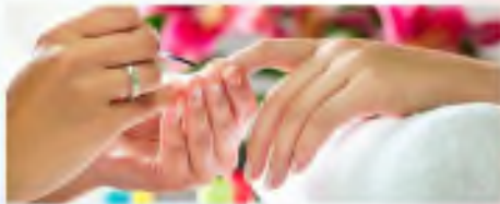
Оказание косметических услуг на дому