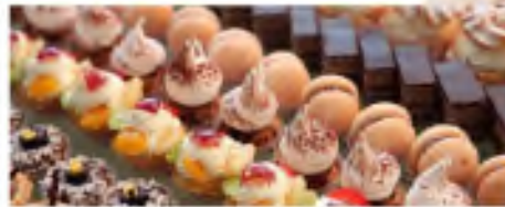
Продажа продукции собственного производства