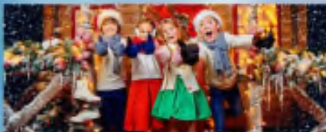
Проведение мероприятий и праздников