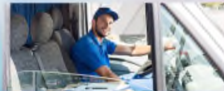
Услуги по перевозке пассажиров и грузов