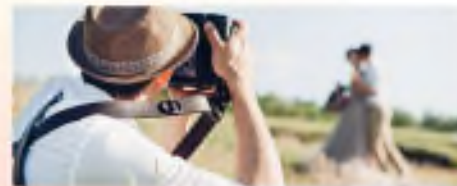
Фото- и видеосъемка на заказ