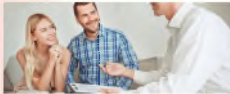
Сдача квартиры в аренду посуточно или на долгий срок