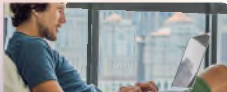
Удаленная работа через электронные площадки