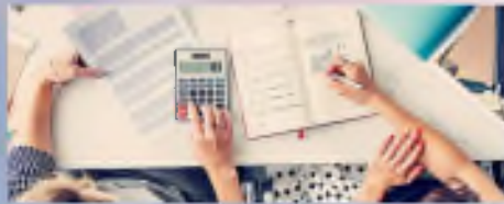
Юридические консультации и ведение бухгалтерии